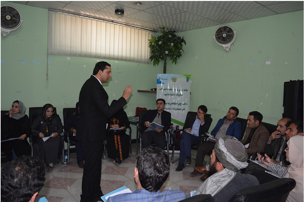
Group discussions among religious leaders, civil society organizations, UN Volunteers and government officials about practical approaches of women's access to health cares, education and economic empowerment in Mazar province, Afghanistan.