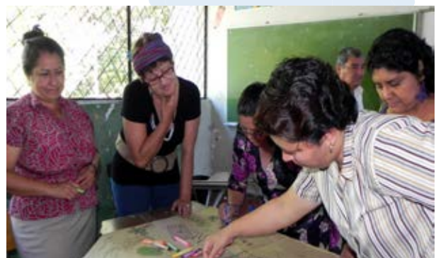
Profesores en Guadalupe, San Vicente, El Salvador, dibujan un plano de cómo sería la escuela ideal durante un taller sobre la reducción del riesgo de desastres celebrado dos veces al mes en la escuela con profesores y miembros de la comunidad.