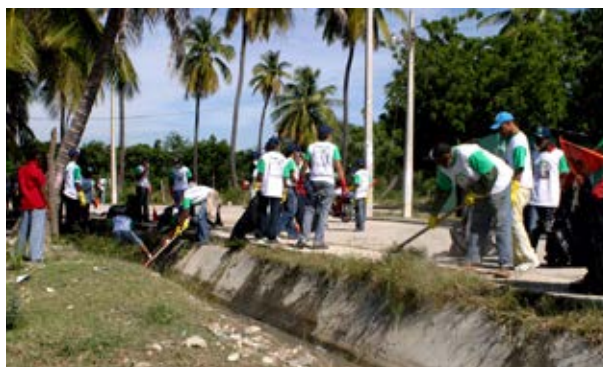
En Ecuador, miembros de una comunidad local participan en una actividad de limpieza.