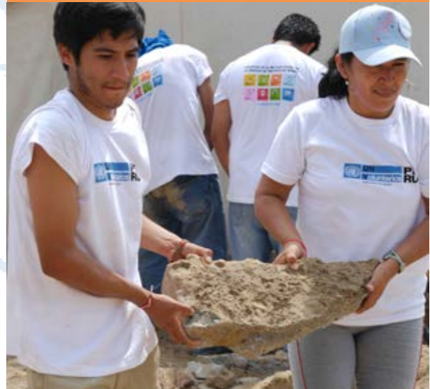
Voluntarios de la ONU rellenan una zanja como parte de un proyecto de reconstrucción sostenible del PNUD y la Dirección de Prevención de Crisis y de Recuperación tras un terremoto en el sur del Perú.

MÁS DE 4.650 VOLUNTARIOS LOCALES HAN SIDO FORMADOS GRACIAS AL FONDO.