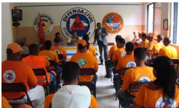
En la República Dominicana, voluntarios en defensa civil participan en una formación sobre primeros auxilios, gestión de riesgos, respuesta ante desastres, uso de GPS y gestión de voluntarios en situaciones de emergencia.

manual de gestión de voluntariado en la respuesta a desastres naturales y gestión de riesgos, que incluía un enfoque de la igualdad de género.