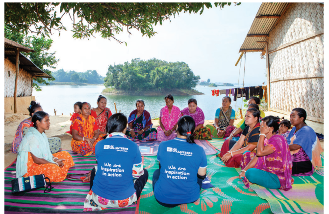
国家联合国社群志愿者与孟加拉国吉大港山区兰加马蒂的受益人会面, 为联合国开发计划署的LoGIC项目提供支持, 以推动实施当地气候适应解决方案。

第二部分 (第4、5、6章) 着眼于在特定环境中衡量志愿服务。它涵盖了志愿服务对个人技能和幸福感的影响以及对发展成果的影响, 并分析了现今的志愿服务衡量框架适应多重危机时代的必要性。 最后一部分 (第7、8章) 介绍了 全球志愿人员参与指数 (GIVE) 。它揭示了志愿服务的多维影响, 并为改进志愿服务数据的生成、理解和使用提供了一条途径。它还总结了本报告的主要政策建议, 并对志愿服务衡量的未来作出思考。