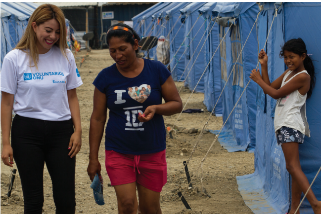
一名联合国志愿人员在厄瓜多尔地震后为应急响应和早期恢复提供支持。 图片来源:联合国志愿人员组织, 2016

归根结底,衡量危机中的志愿服务不仅仅是计算投入情况。它提供的证据可作为促成 认可、建立团结并采取更公平的综合应对措施的信息参考 。衡量志愿服务的工作通过揭示志愿人员行动如何连接人道主义和发展努力,成为加强韧性、为危机治理提供信息参考和实现持续集体行动的工具。