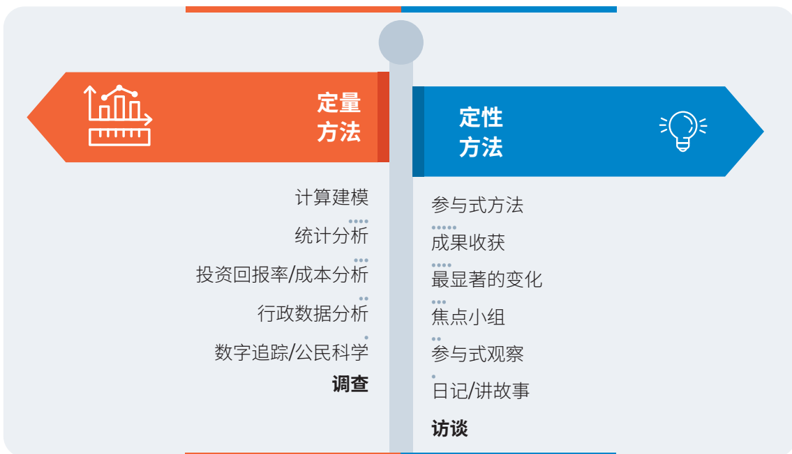
图1. 衡量工具和方法库

本章最后展望未来, 指出公民生成数据等技术进步带来了新的机遇。我们面临的持续挑战是建立具有包容性、背景敏感性并能代表各种形式志愿服务的强大数据系统, 特别关注常被忽视的非正式和社区主导的志愿人员行动。