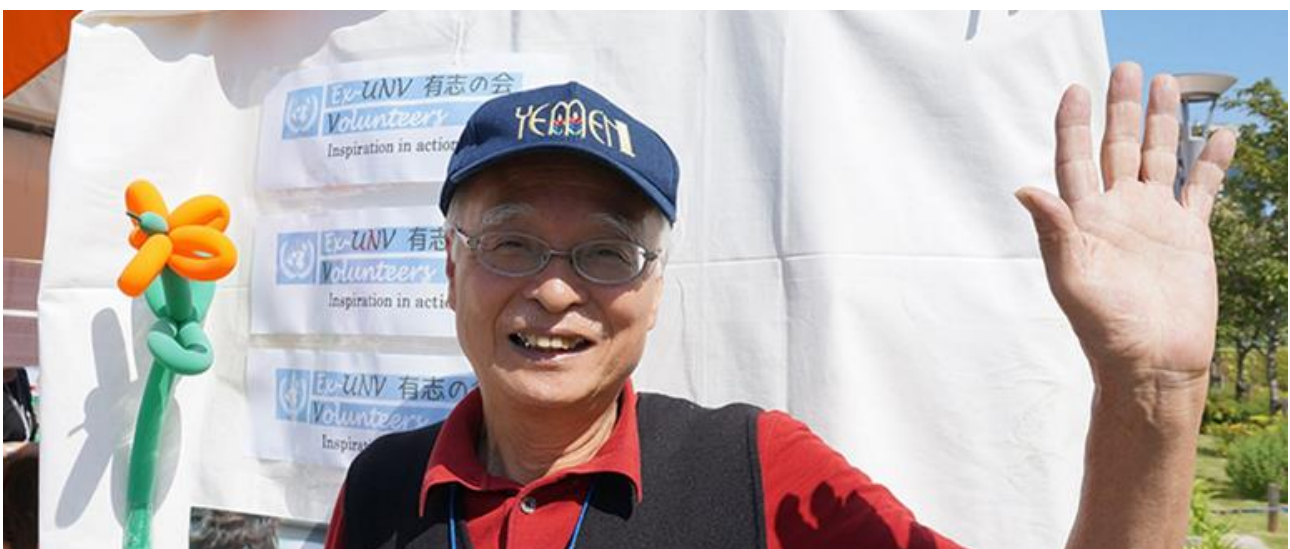
グローバルフェスタ JAPAN 2017にて (UNV、2017)