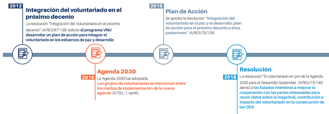
Figura 1 Resoluciones Claves de La Asamblea General de Las Naciones Unidas que mencionan el voluntariado.

el reconocimiento y la integración del voluntariado en los ODS. A través de los esfuerzos concertados de los voluntarios, los gobiernos, la sociedad civil, el sector privado y las Naciones Unidas, el Plan de Acción busca fortalecer la apropiación de la Agenda 2030 por parte de las personas, integrar e incorporar al voluntariado en las estrategias y políticas nacionales, y medir mejor el impacto del voluntariado.