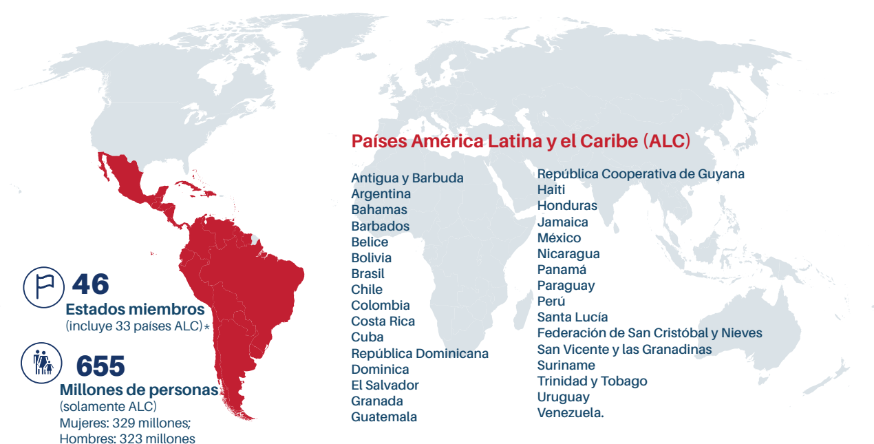
Figure 3 Mapa de la región américa latina y el caribe.

* Los 33 países de América Latina y el Caribe, junto a algunos de Asia, Europa y América del Norte con los que tienen lazos históricos, económicos y culturales con la región, componen los 46 Estados miembros de CEPAL. Catorce territorios no independientes en el Caribe son Miembros Asociados de la Comisión.